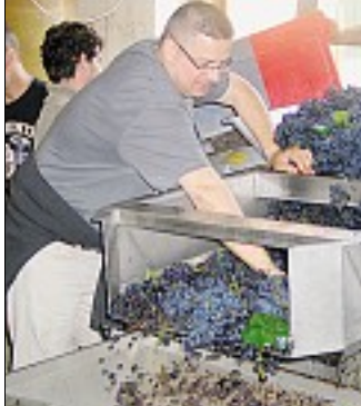
PINOT NOIR. Égrappage et ultime tri du pinot noir avant la mise en cuves.

ont démarré les vendanges pour le sauvignon au même titre que leurs collègues viticulteurs de quincy. Le pinot noir, lui, macère à froid en cuve après un égrappage et un ultime tri des grains abîmés. Début d'un autre travail, l'élevage, qui ne s'achèvera finalement que lorsque vous... ouvrirez la bouteille. ■