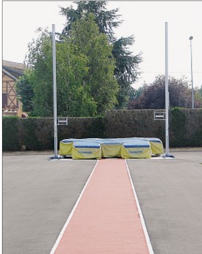
ATHLÉTISME. Aire de saut à la perche toute neuve entre les stades Robert-Barran et Constant-Duval.

Au fil de la visite, d'autres travaux ont été évoqués : l'extension du gymnase Fernand-Léger, avec ajout de vestiaires, d'un local de stockage et aménagement de