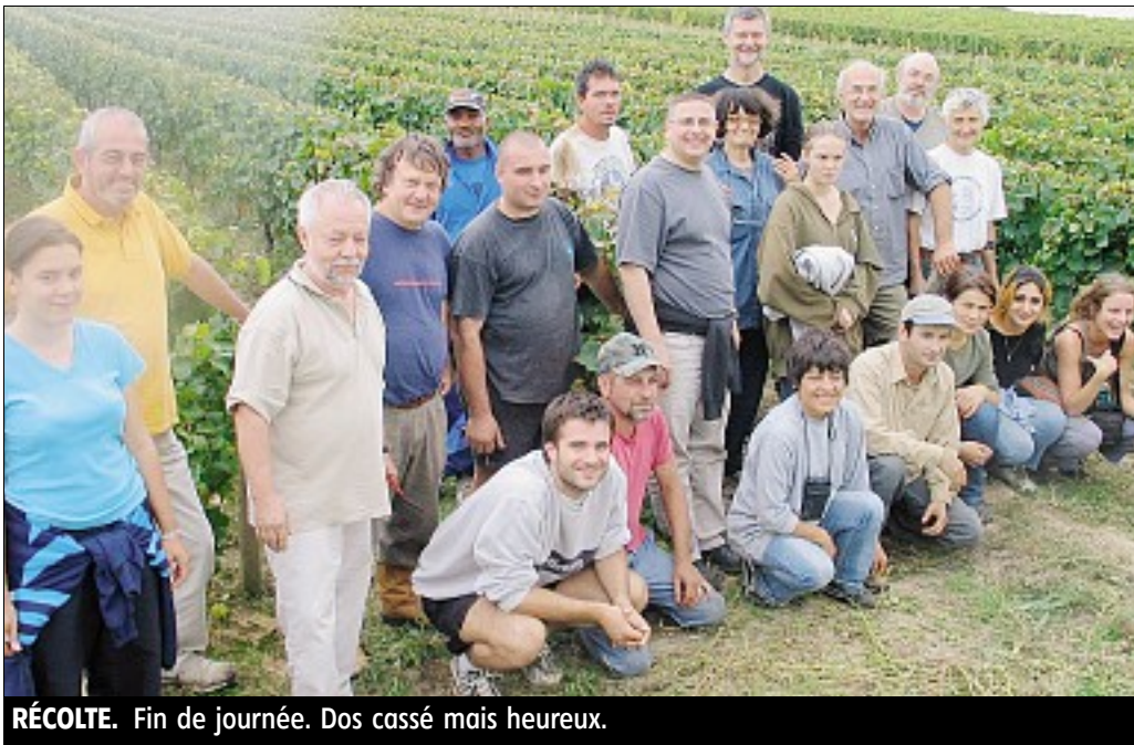
RÉCOLTE. Fin de journée. Dos cassé mais heureux.

Jours de travail. Jours de partage aussi. « En plus de